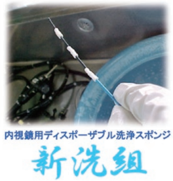
内視鏡用ディスプレイザブル洗浄スポンジ