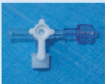
三方活栓 ロック型